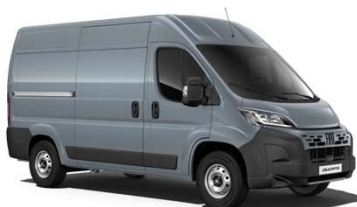
Šedá Ferro (691)