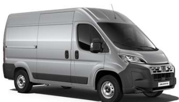
Šedá Artense (113)