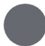
Šedá Ferro (691)